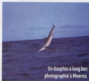
Un dauphin à long bec photographié à Moorea.

- Air Tahiti Nui La compagnie aérienne propose des vols pour Papeete via Los Angeles, 3 fois par semaine, au départ de Paris Charles de Gaulle, Terminale 2A. Pour la contacter : 28, bd Saint-Germain, 75005 Paris, tél. 01.56.81.13.30, fax : 01.56.81.13.39, e-mail : resa@airtahitiniui.fr Informations et réservations : 0825.02.42.02.