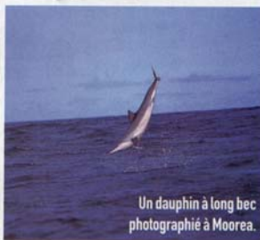
Un dauphin à long bec photographié à Moorea.

- Air Tahiti Nui La compagnie aérienne propose des vols pour Papeete via Los Angeles, 3 fois par semaine, au départ de Paris Charles de Gaulle, Terminale 2A. Pour la contacter : 28, bd Saint-Germain, 75005 Paris, tél. 01.56.81.13.30, fax : 01.56.81.13.39, e-mail : resa@airtahitiniui.fr Informations et réservations : 0825.02.42.02.